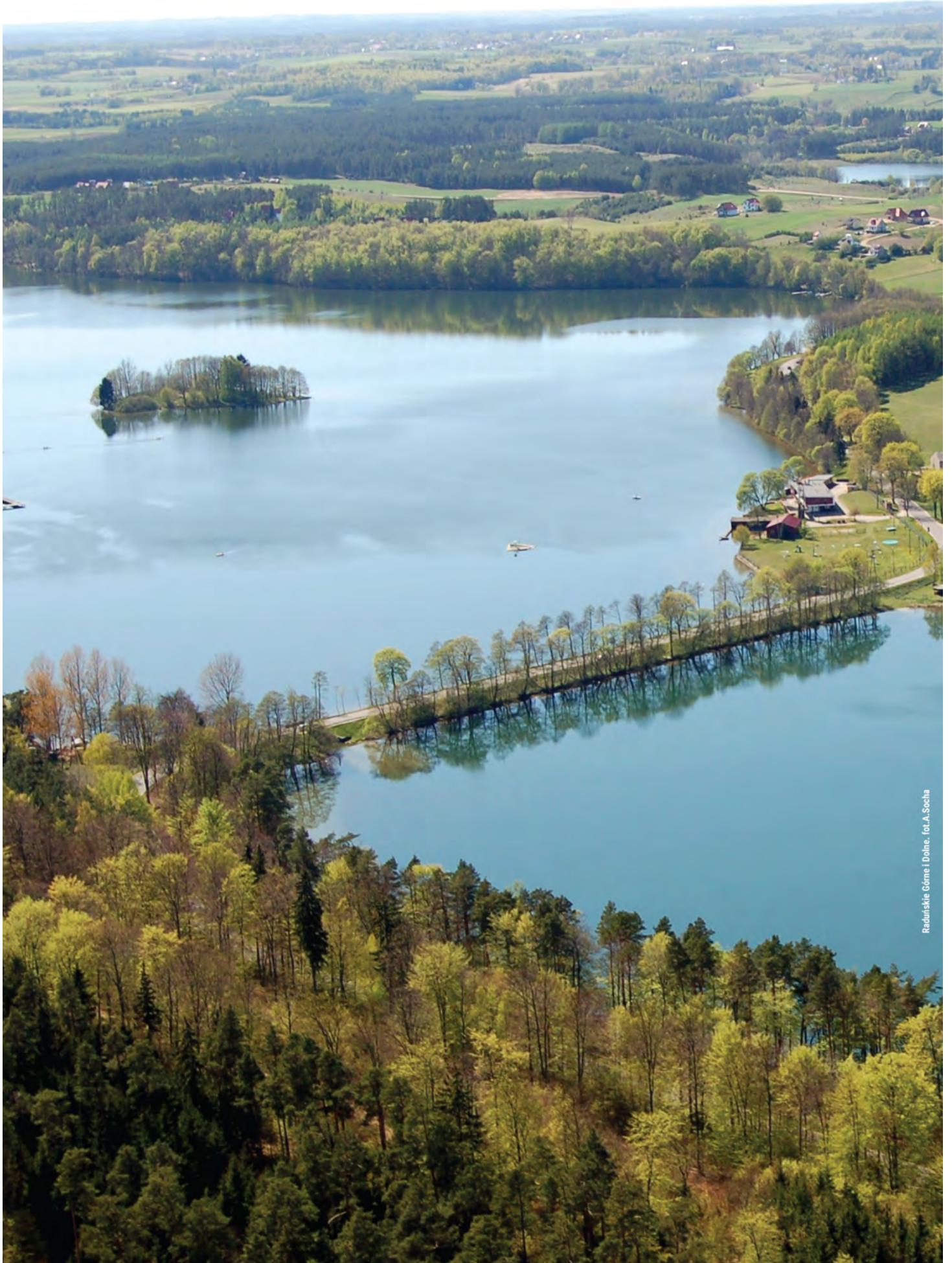
Radziwiłłskie Górnice i Dolne