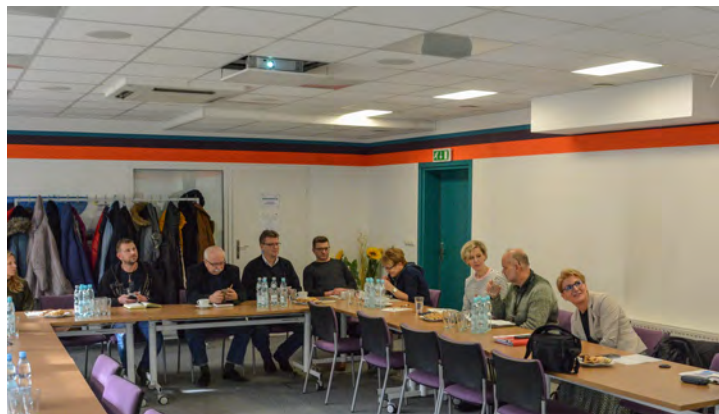
Warsztaty poświęcone aktualizacji strategii

Strategia rozwoju jest najważniejszym dokumentem planistycznym wszystkich samorządów, określającym wizję i cele polityki regionalnej w wymiarze gospodarczym, społecznym i przestrzennym. Stanowi ważny instrument ukierunkowujący działania i umożliwiający podejmowanie decyzji na dziś i na wiele najbliższych lat.