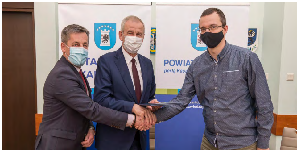
Podpisanie umowy z firmą Przewozy Autobusowe Gryf

30 grudnia 2020 r. wyłoniono 3 przewoźników do obsługi nowych linii, które częściowo zmodyfikowano w stosunku do dotychczasowych. Chodziło