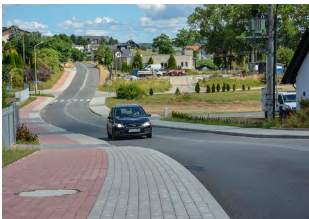
Druga Wygoda Łączyńska - Chmielno

finansowania pozwolił Powiatowi Kartuskiemu uzyskać w latach 2019 - 2020, dofinansowanie w łącznej wysokości ponad 5,3 mln złotych. Z tych środków przebudowano, rozbudowano i wyremontowano m. in. drogi: Czeczewo-Przodkowo, Wygoda Łączyńska-Chmielno, Pępowo-Leżno oraz Kiełpino-Pikarnia.