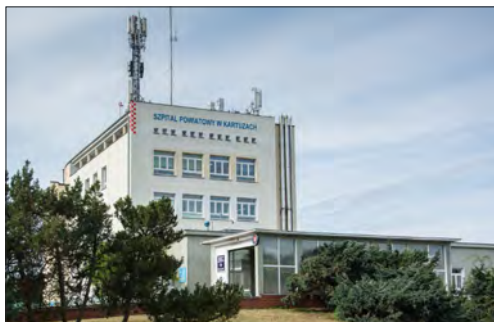
Powiatowe Centrum Zdrowia w Kartuzach

Skutek ewentualnych zmian w zakresie funkcjonowania szpitali dotknie bezpośrednio Powiatowe Centrum Zdrowia Sp. z o.o. w