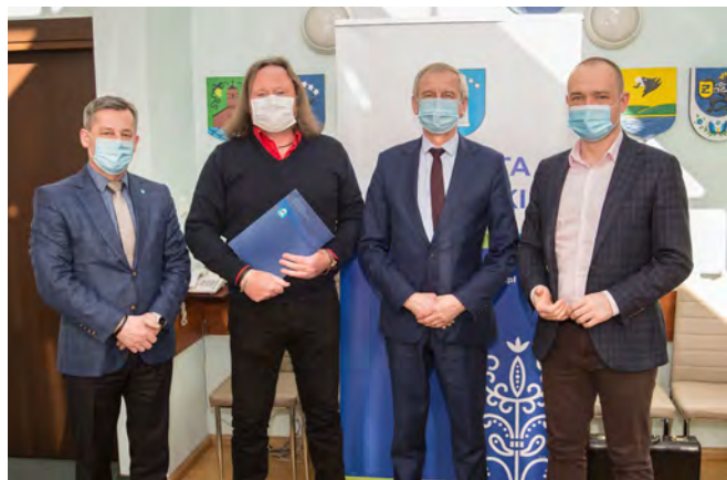
Władze Powiatu i gminy Żukowo z wykonawcą

Władze Powiatu Kartuskiego wspólnie z Gminą Żukowo rozpoczęły działania w kierunku realizacji nowego zadania inwestycyjnego pn. Budowa hali widowiskowo – sportowej wraz z zagospodarowaniem terenu przy Zespole Szkół Zawodowych i Ogólnokształcących oraz Szkole Podstawowej nr 1 w Żukowie . W tym celu został wyłoniony wykonawca, którego zadaniem będzie przygotowanie koncepcji oraz dokumentacji projektowej budowy hali widowiskowo - sportowej w Żukowie.