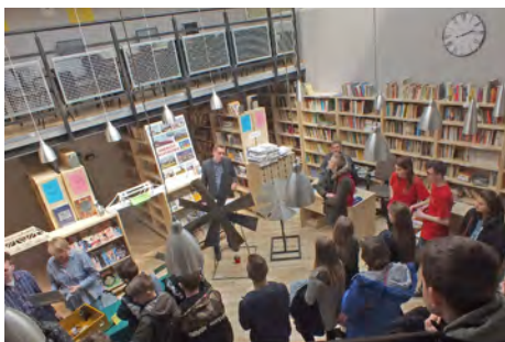
ZST w Kartuzach, spotkanie z doradcą zawodowym

być może zachęci tegorocznych absolwentów klas ósmych do podjęcia kształcenia w tych zawodach. Powiatowe szkoły zawodowe prowadzą takie kierunki i czekają na chętnych.