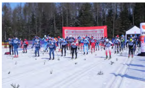
Start biegu

W pierwszy weekend marca zawodnicy Cartusii startowali w 45. Biegu Piastów w Jakuszycach oraz w Mistrzostwach Polski Amatorów w