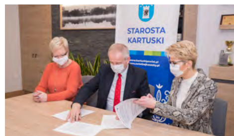
Starosta Kartuski podpisuje umowę na realizację projektu