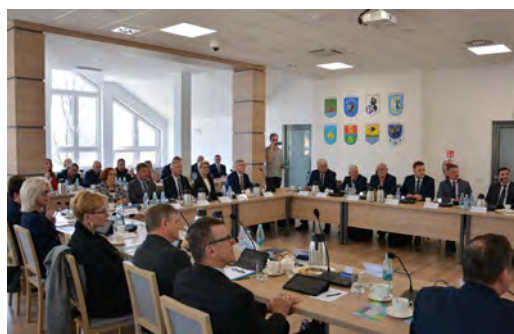
Z obrad Rady Powiatu Kartuskiego

3 marca br. został podpisany akt notarialny o przekazaniu budynku po Sądzie Rejonowym w Kartuzach na rzecz Powiatu Kartuskiego. Obiekt zostanie przebudowany i rozbudowany, a swoje miejsce znajdą w nim wydziały: geodezji, budownictwa oraz Powiatowy Inspektor Nadzoru Budowlanego. Obecnie trwają prace nad koncepcją adaptacji budynku. Prace remontowo - budowlane rozpoczną się w tym roku. Docelowo przedsięwzięcie to z pewnością ułatwi obsługę naszych mieszkańców. Powiat, na wniosek Starosty, pozyskał ten budynek z zasobów Wojewody Pomorskiego.