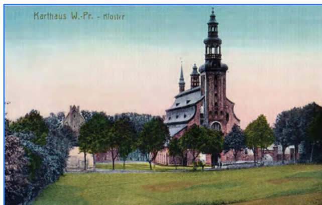
Reprodukcja pocztówki z 1908 r.