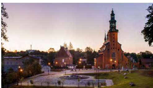
Kolegiata p.w. WNMMP w Kartuzach

- 90 tys. zł. parafia rzymskokatolicka p.w. Świętych Apostołów Piotra i Pawła w Chmielnie - wymiana pokrycia dachu w kościele p.w. Świętych Apostołów Piotra i Pawła.