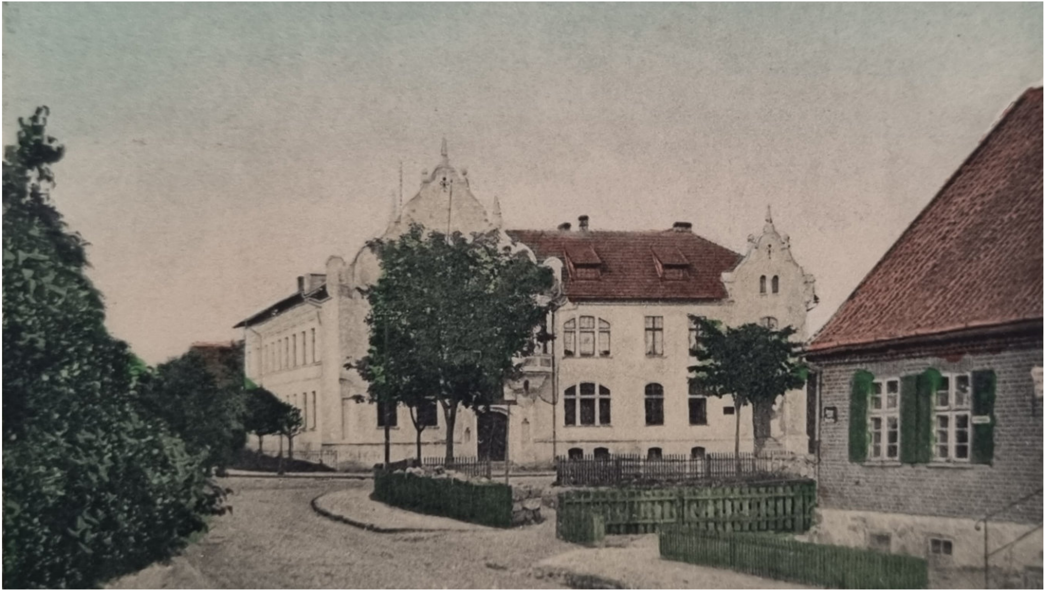
Kartuzy, przełom XIX i XX wieku