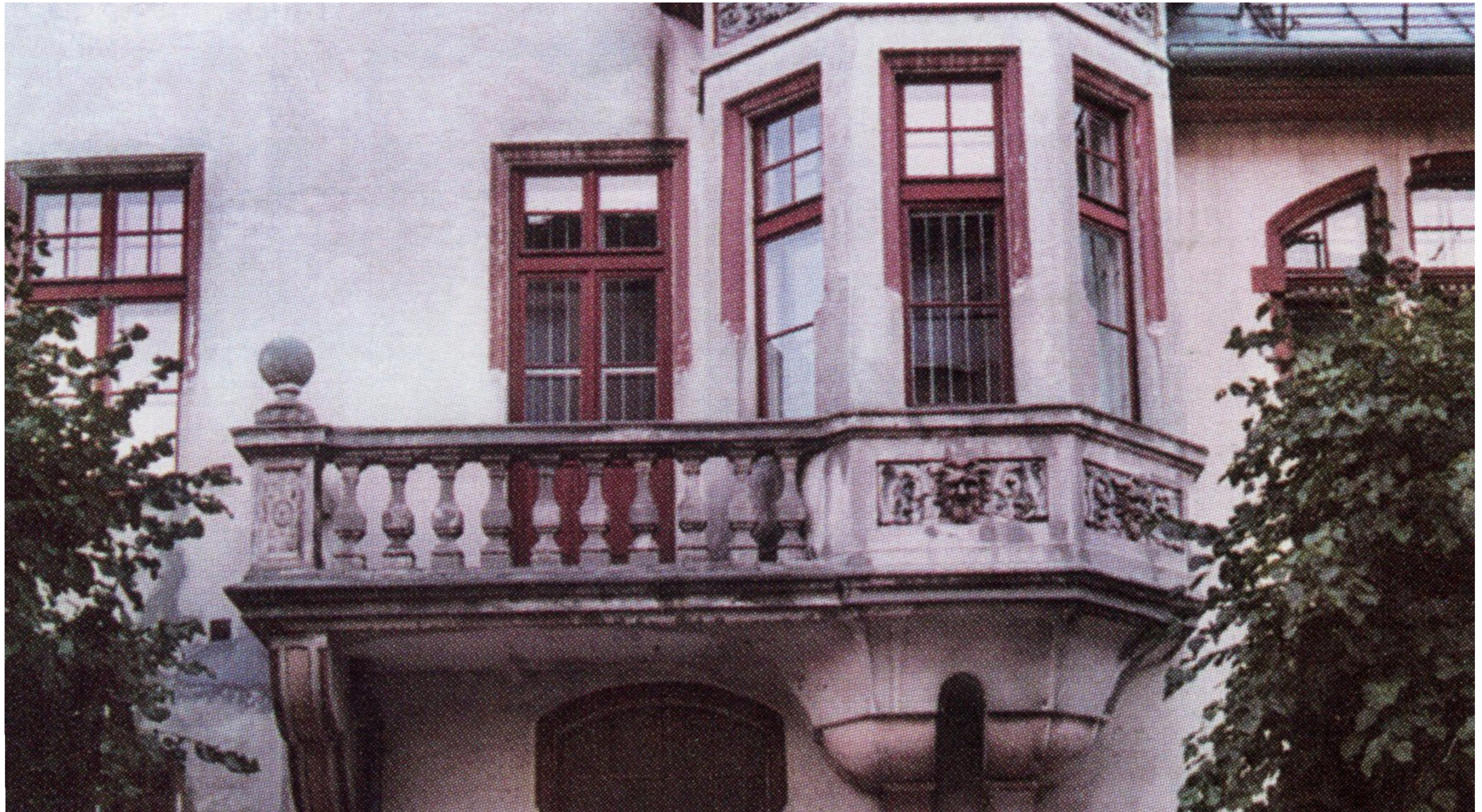
Detale elewacji przed i po remoncie