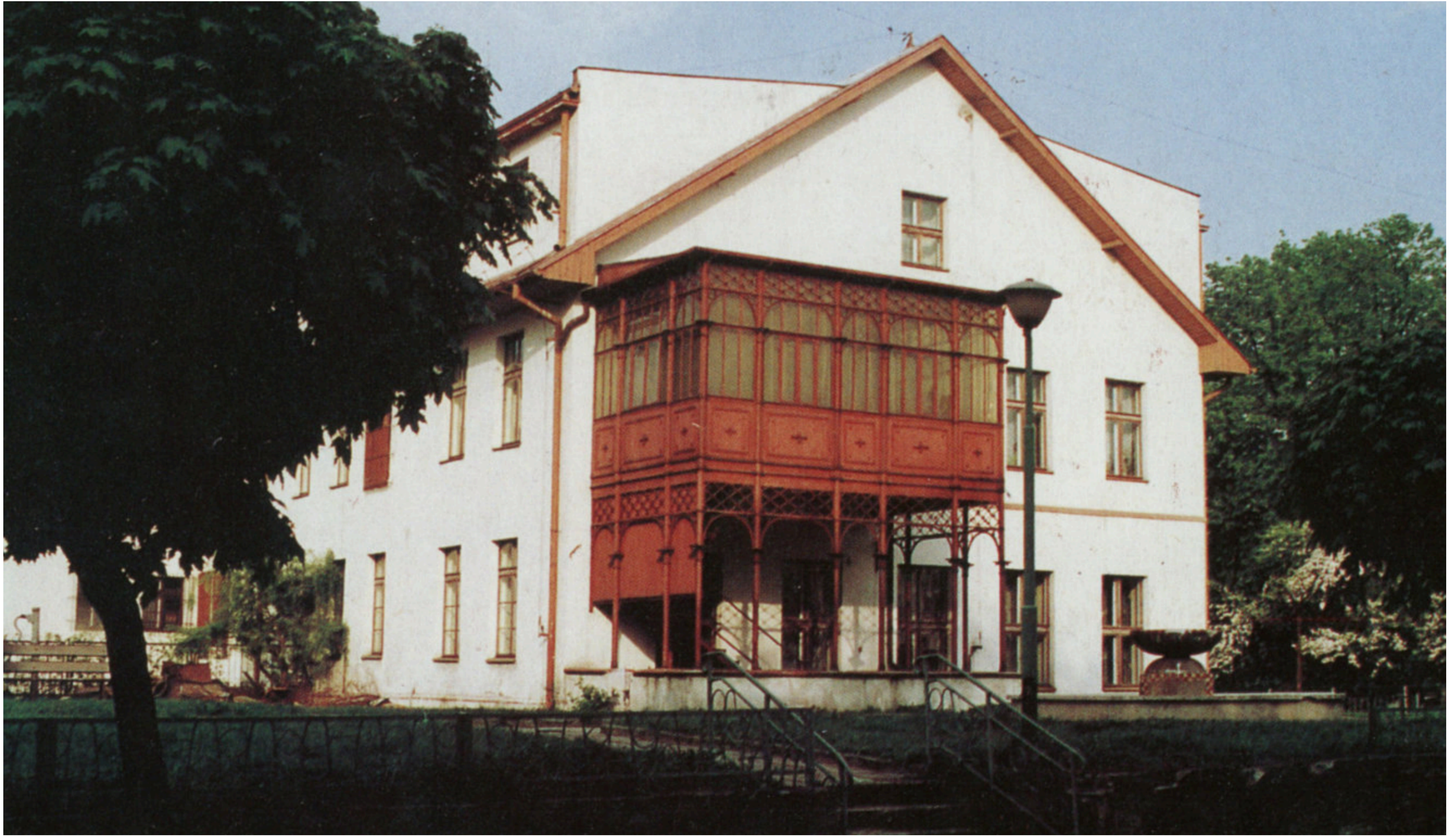
Stalowa, secesyjna oranżeria - przed i po remoncie