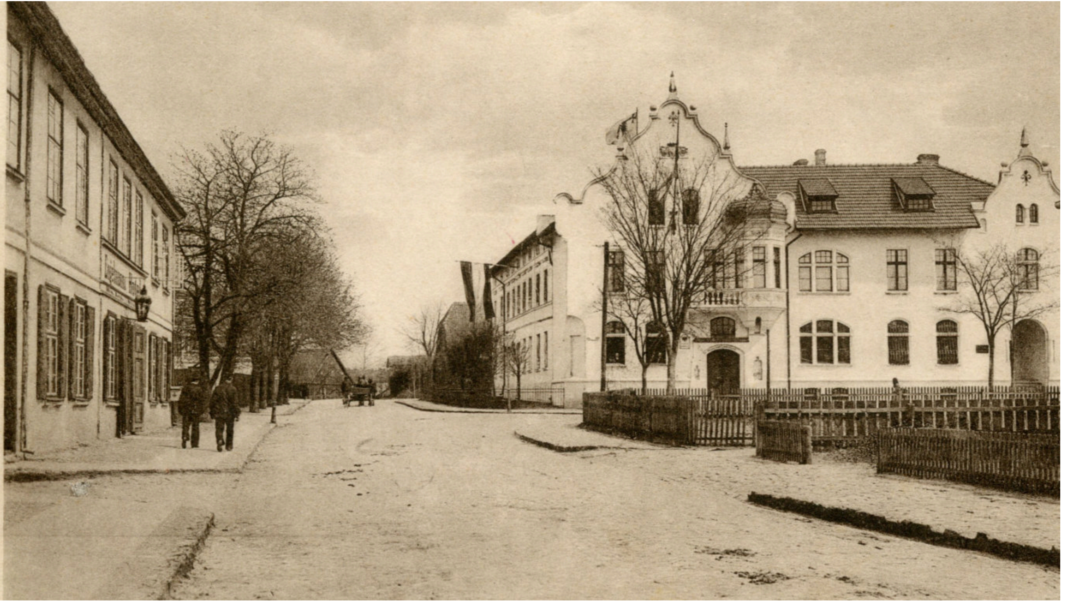
Kartuzy z początku XX wieku