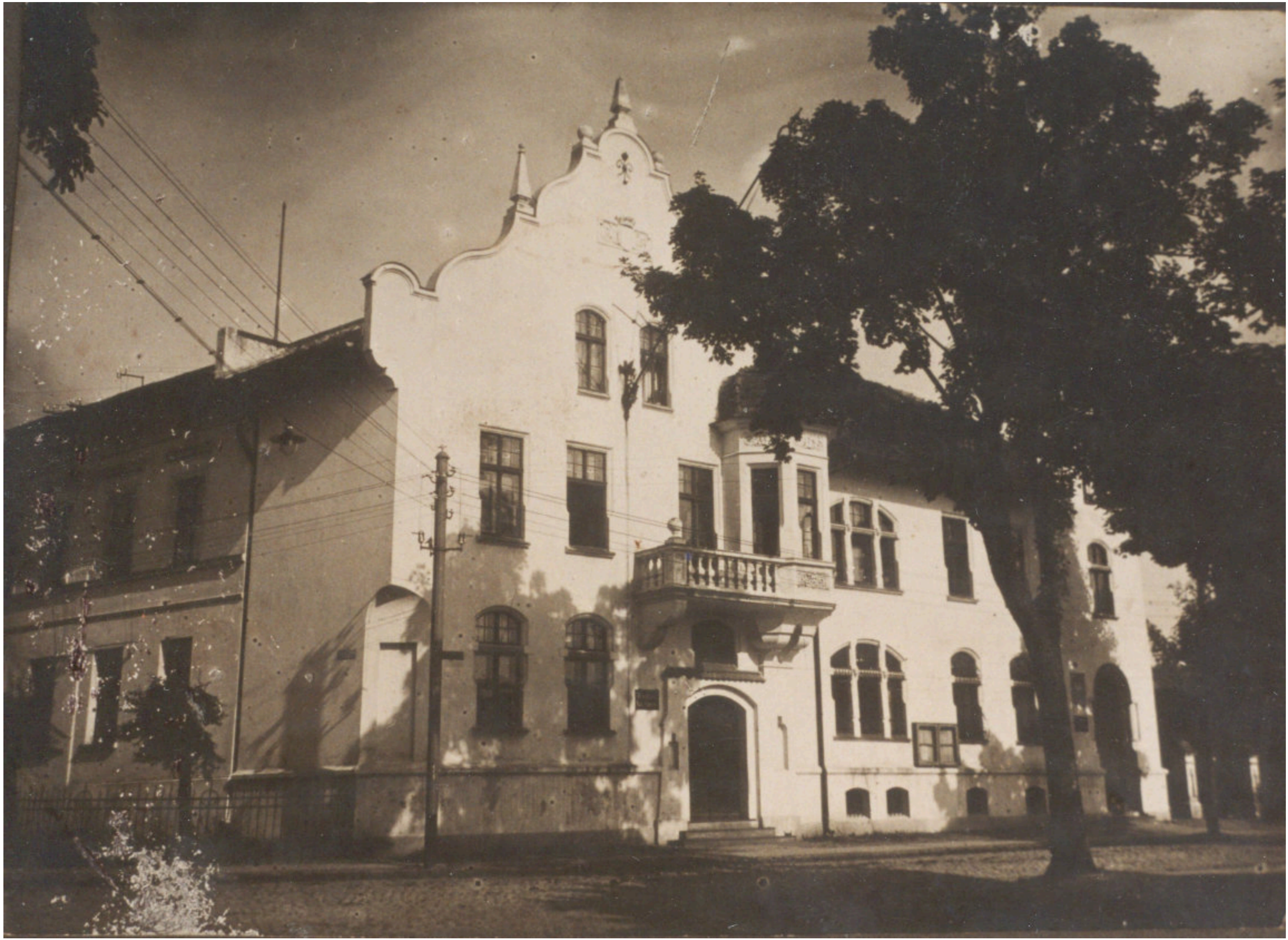
Kartuzy, lata międzywojenne