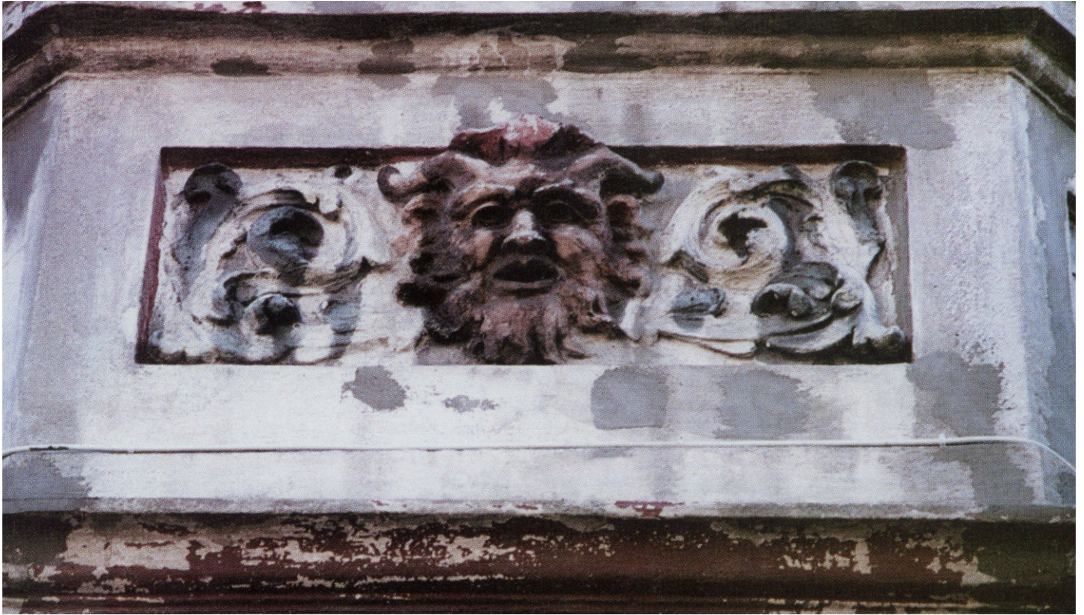
Detale elewacji przed i po remoncie